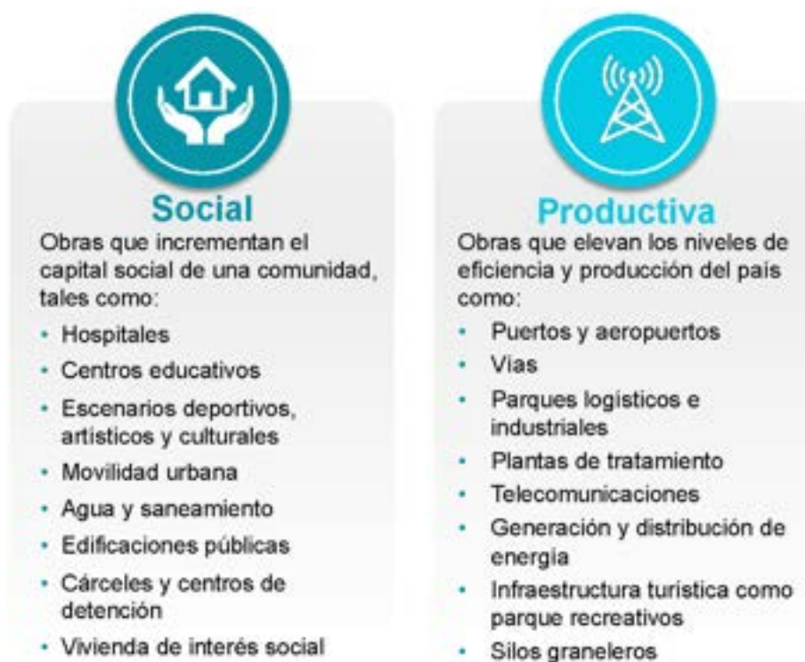
Figura 32. Principales sectores para los que usan las APP