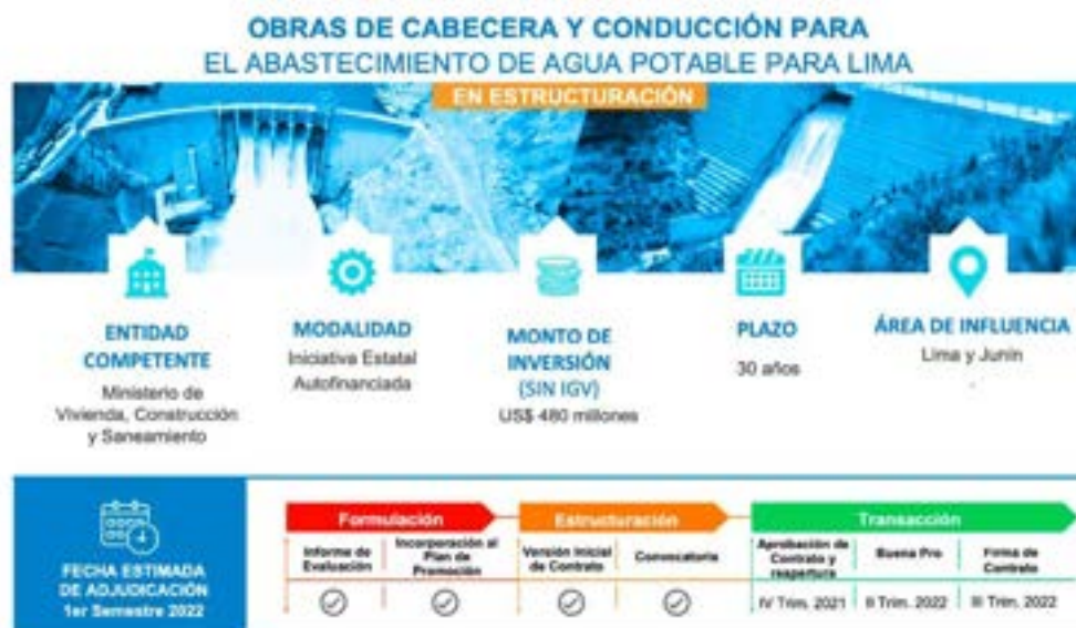
Figura 36. Ejemplo de ficha conceptual de proyecto APP