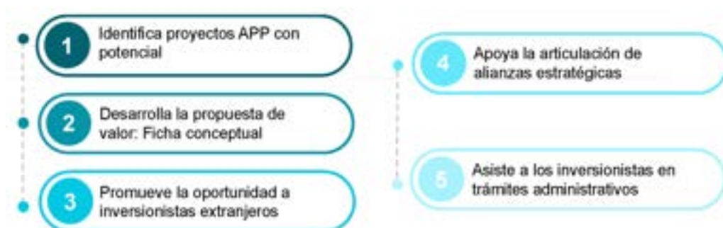
Figura 33. Pasos para promover proyectos APP

En línea con el rol de la APRI descrito anteriormente, la figura 33 presenta un esquema de cinco pasos que describe las actividades principales a considerarse en la promoción proactiva de proyectos APP a inversionistas extranjeros: