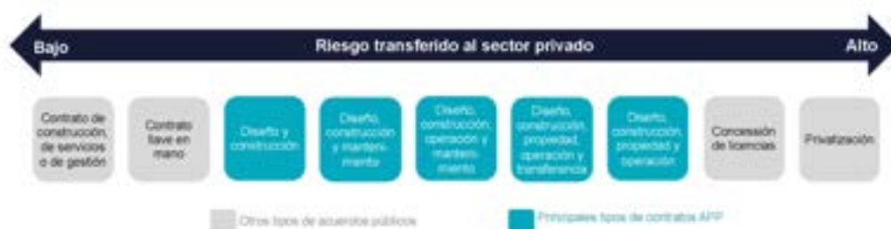
Figura 29. Distintos tipos de contratos APP según el riesgo transferido