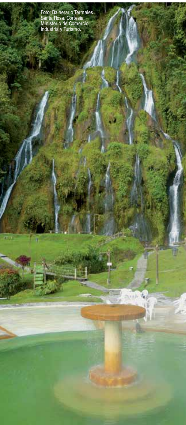
Foto: Balneario Termales Santa Rosa.

En poco más de un año, los lentes de 72 periodistas internacionales registraron los atractivos turísticos del Paisaje Cultural Cafetero, región conformada por los departamentos de Caldas, Risaralda y Quindío.