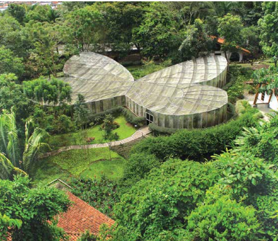
Foto: Mariposario de Calarcá. Cortesía Ministerio de Comercio, Industria y Turismo.

20 EMPRESAS DE LA REGIÓN ESTUVIERON PRESENTES EN EL COLOMBIA TRAVEL MART 2013, LAS CUALES SOSTUVIERON CITAS DE NEGOCIOS CON LOS COMPRADORES INTERNACIONALES LLEVADOS AL EVENTO POR PROEXPORT.