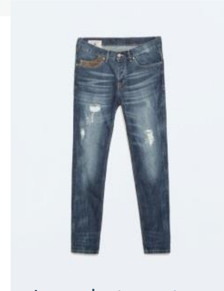
Jeans bota recta para hombre Zara EUR39,95