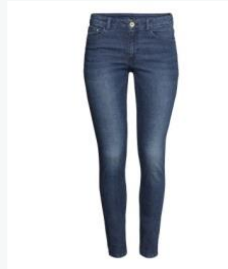
Skinny jeans H&M EUR19,99

Después del tejido denominado como mezclilla, el tencel se establece como la principal tela para esta categoría de productos en España.