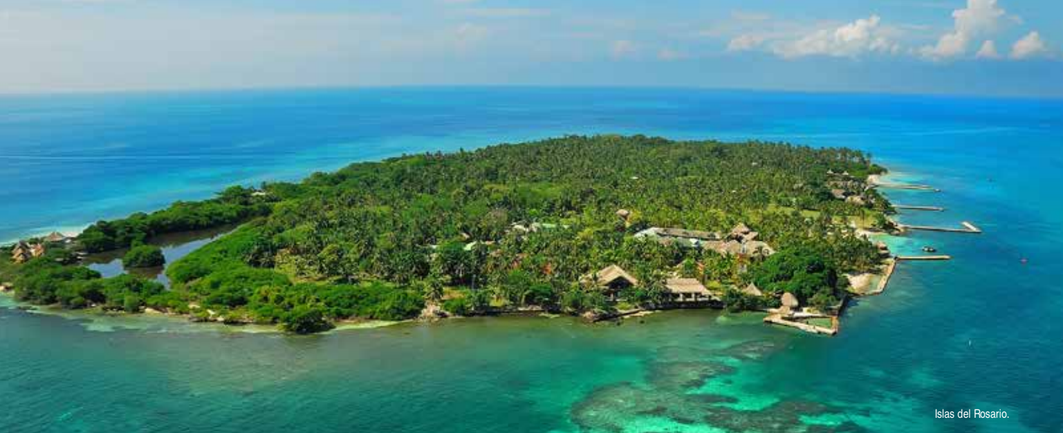
Islas del Rosario.