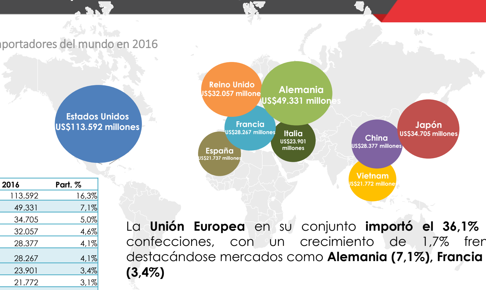
Principales importadores del mundo en 2016